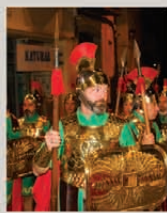
Armats de Mataró

Avui comença la segona gran celebració del calendari mataroní, fruit d'un model mixt entre tradicions de tot l'Estat. En repassem els protagonistes.