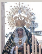
Nostra Senyora dels Dolors