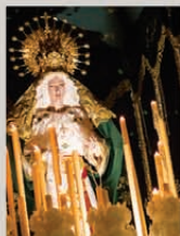
Nuestra Señora de la Esperanza