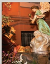
Oració del Senyor a l'Hort