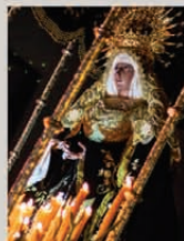
Nuestra Señora de la Soledad