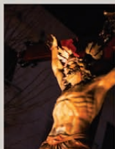
Sant Crist de l'Agonia