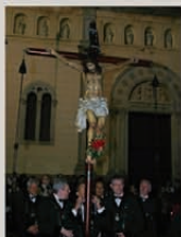
Sant Crist de la Bona Mort